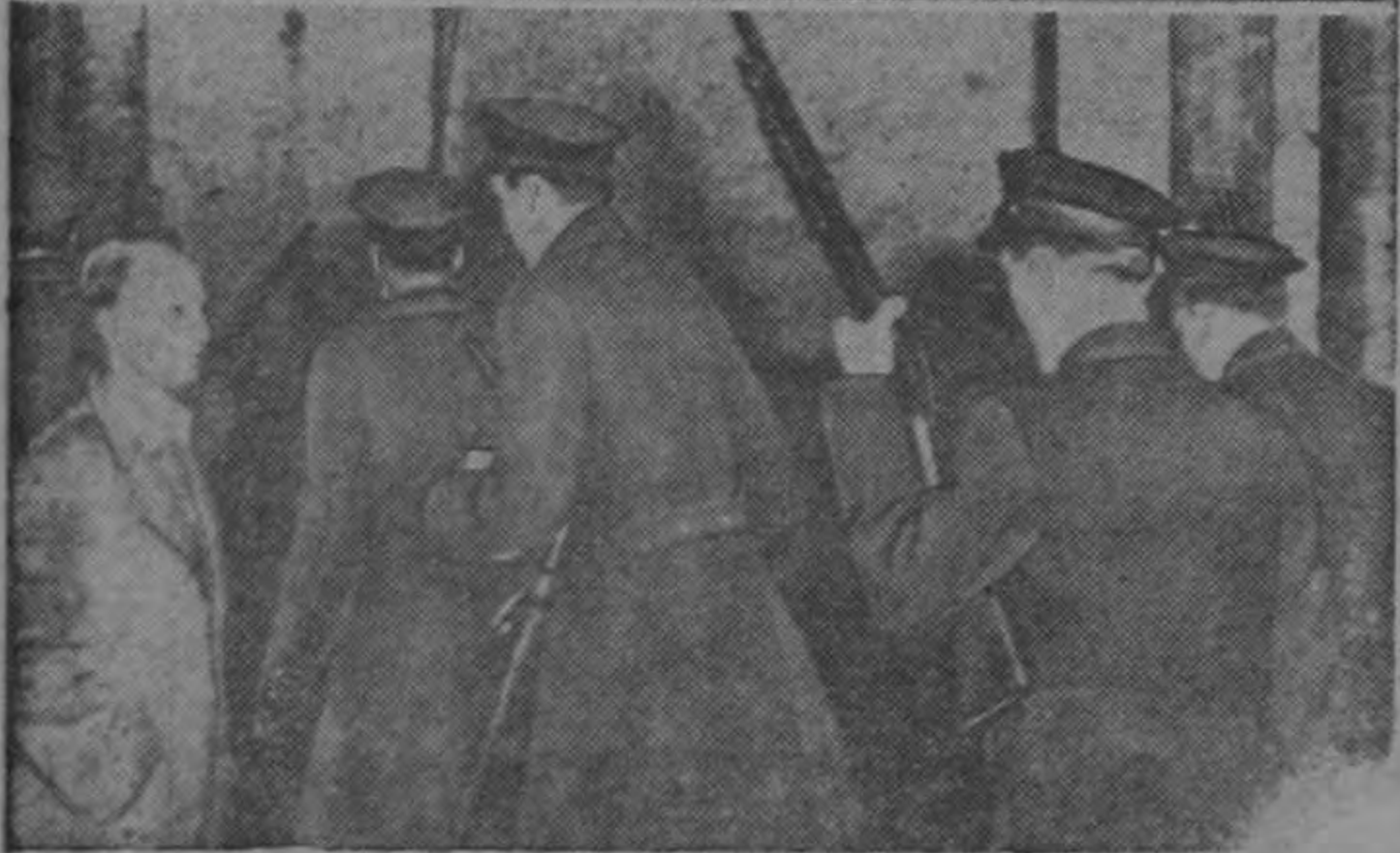
Arriba, un edificio donde se fabricaban chapas para automóviles aparece incendiado por los penados amotinados de la Western State Penitentiary, en Pittsburgh, Pensilvania. Abajo, algunos de los 700 policías que fueron llamados para restablecer el orden, entran por una puerta lateral a la penitenciaría donde 1.100 penados mantenían a 5 guardias como rehenes. Los penados pedían 13 reformas en los reglamentos de la prisión.