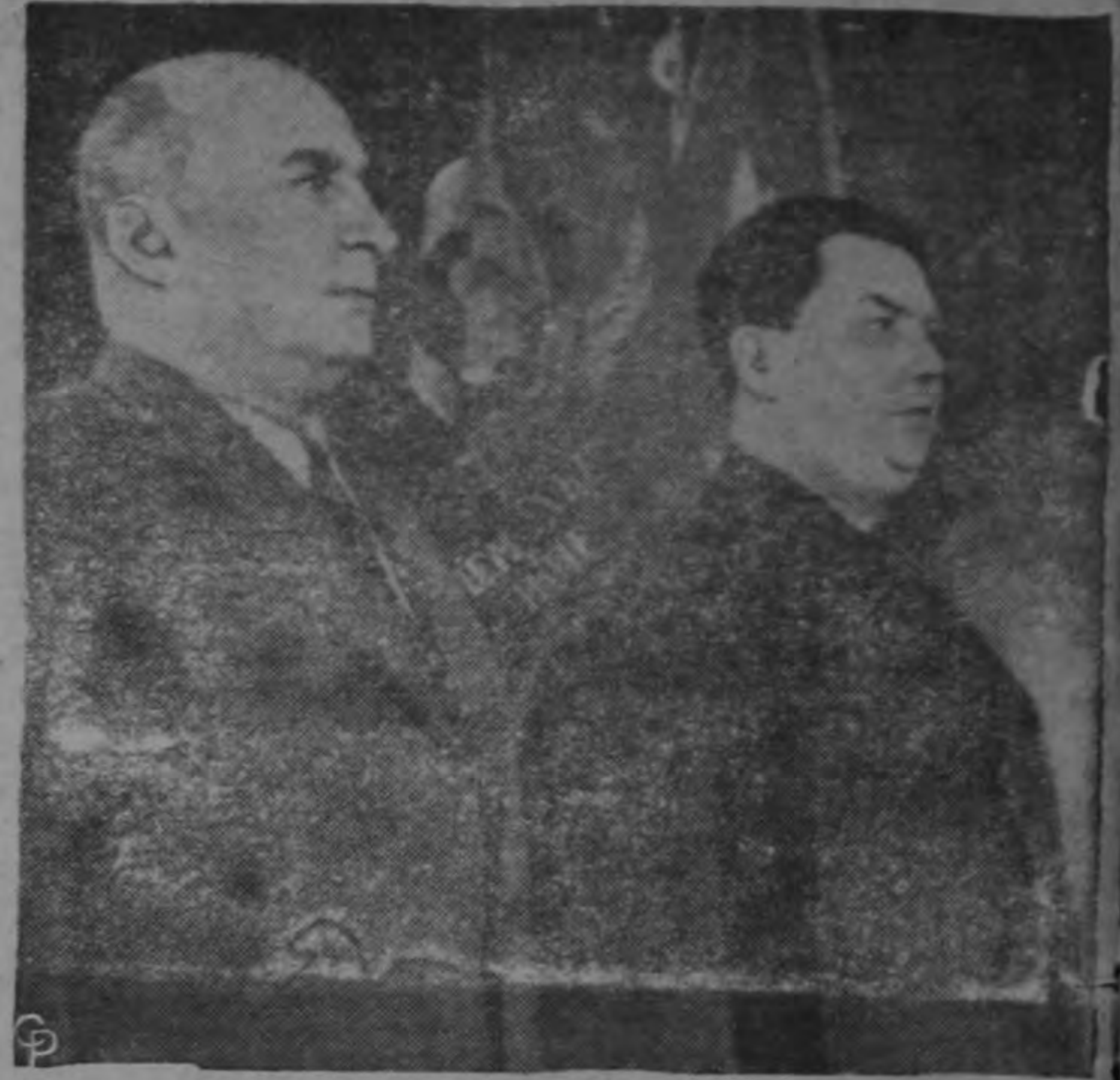
Según informaciones de Londres, la depuración emprendida en los Soviets en contra de nueve médicos, sería heraldo de una lucha por el poder en que se disputaría el manto del Premier José Stalin. De acuerdo con esas mismas informaciones la lucha envolvería a Lavrenti P. Beria (izquierda) que ha estado a la cabeza de la policía secreta soviética, y a Georgi Malenkov, Premier Delegado, considerado como el más probable sucesor de Stalin.