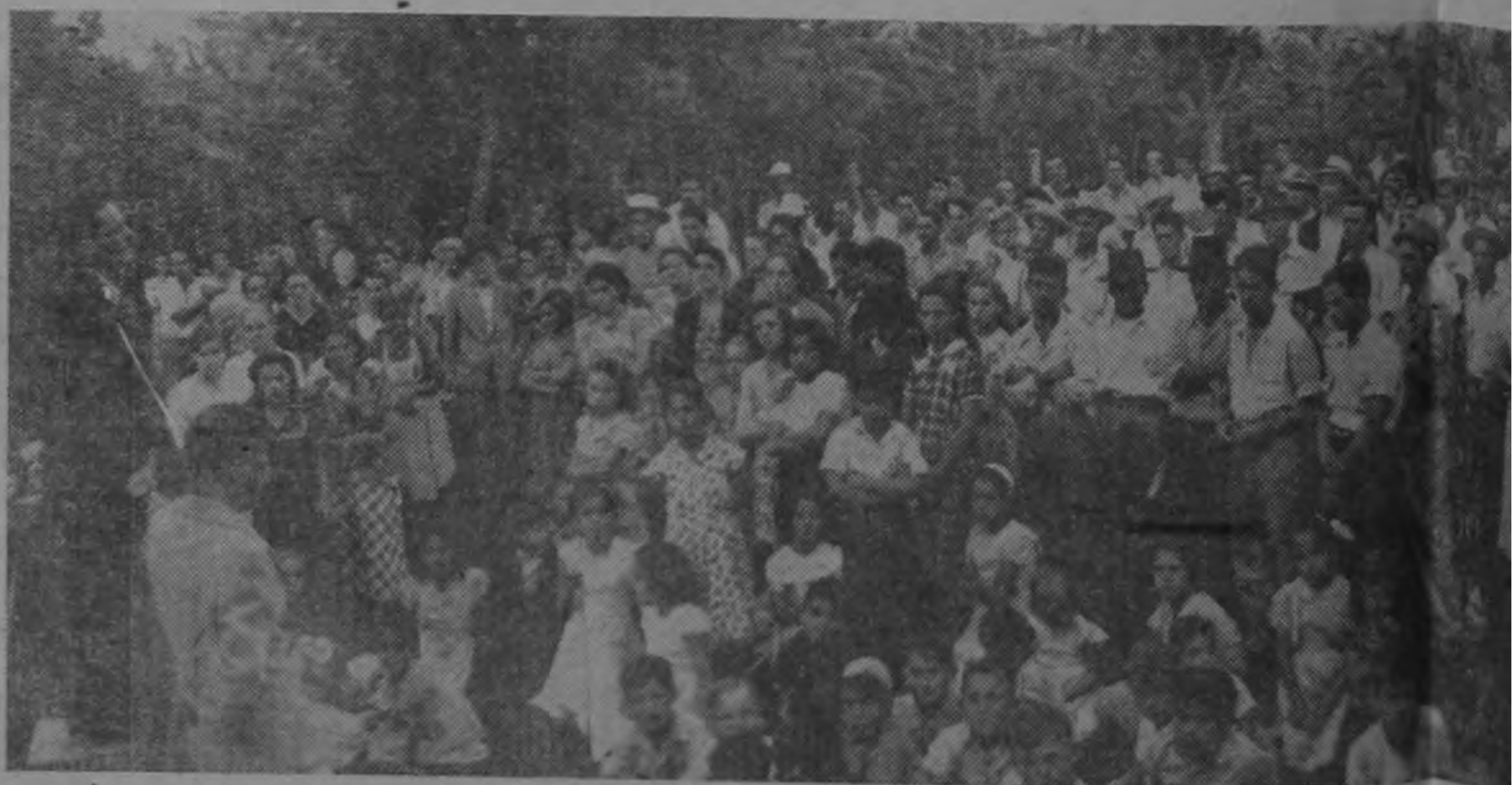
Arriba el caudillo dirigiéndose a los vecinos de San Lorenzo desde una Abajo el Libertador, posa con los miembros de la distinguida familia de